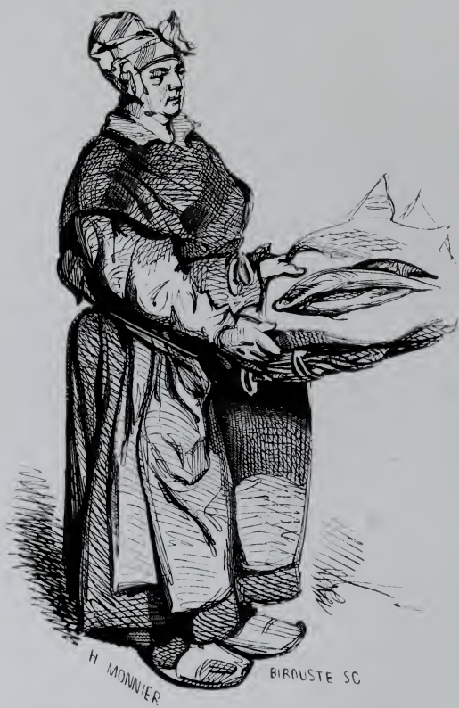
La Marchande de Poissons.